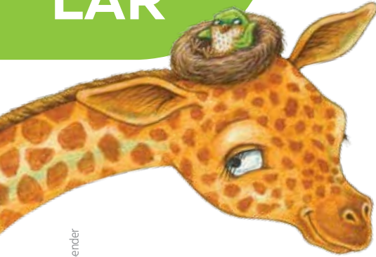
Ilustración de Rebecca Bender